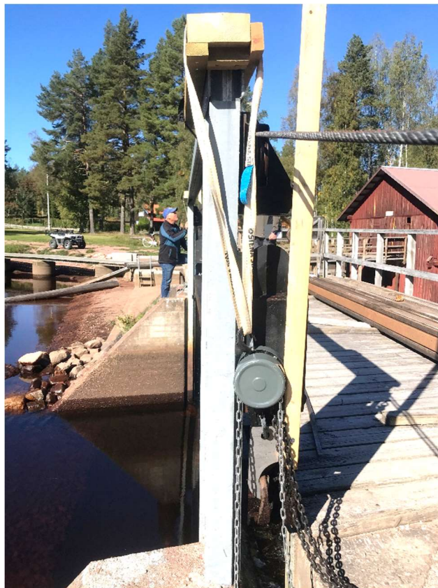
Bild 8. Sätten upphissad så långt det går med slingen på detta vis. Sätten behöver höjas något mer för att upplagsreglarna enkelt ska kunna skjutas in. Slingen bör därför dras ett varv kring träupplagen. Slingen på östra sidan bör dessutom gå på ömse sidor om vajrarna. Observera att träupplaget är felvänt.