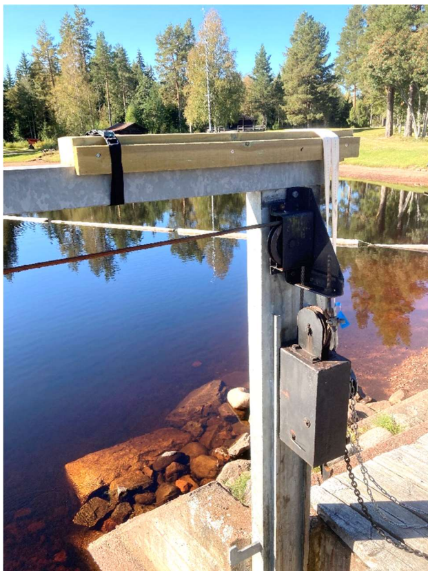
Bild 3. Träupplaget monterat, dock felvänt, och fixerat med litet spännband.