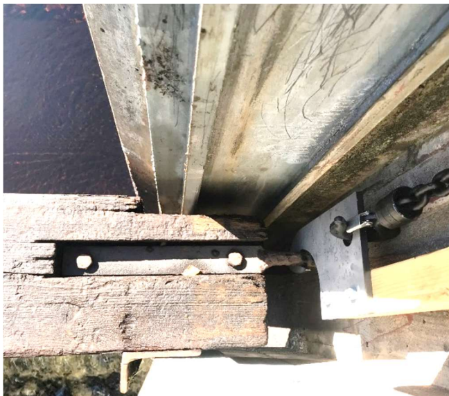
Bild 7. Sätten på väg upp. Bilden visar plåtkroken häktad kring sättens lyftögla och kättingspelets nedre krok fäst i plåtkroken. Observera hur plåtkrok med regel är vänd. Uppströms är uppåt i bild.