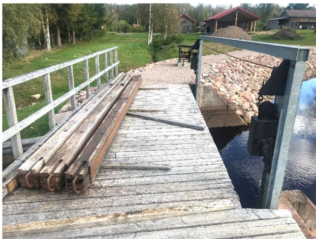
Bild 1. Sättarna förvaras på brobanan när de inte är ilagda.

Flodutskovet har fem hela sättar ca 220 mm höga och en halv sätt ca 120 mm hög. Sättarna består av en stålbalk IPE200 med två träplankor 50x200 mm på vardera sidan. Sättarna hålls ihop med genomgående bultar c/c 1 m. I ändarna finns "lyftöglor" som lyftanordningens krokar hakar fast i. Se Bild 1 och 2.