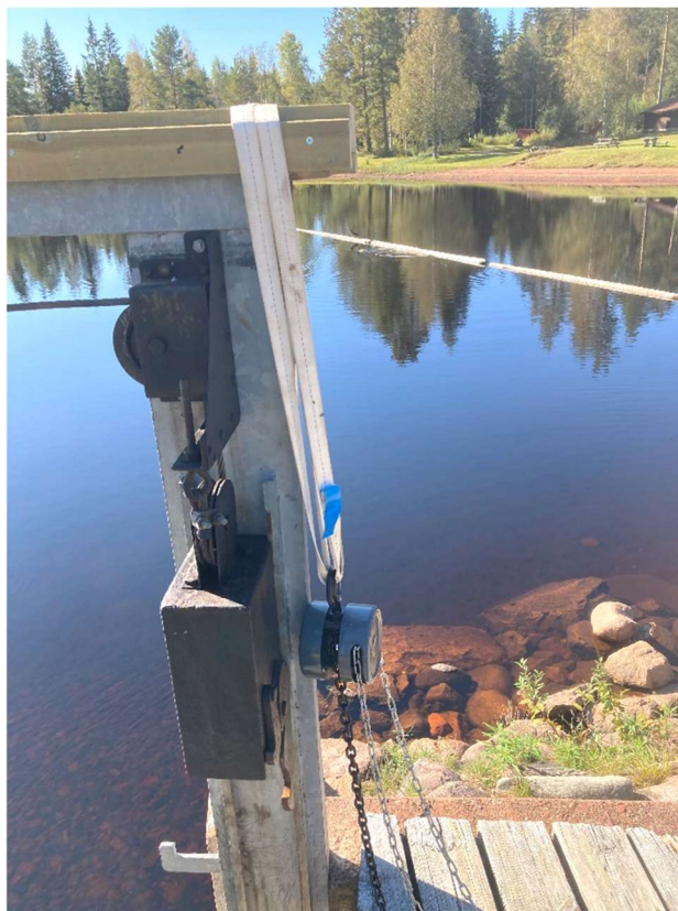
Bild 4. Kättingspelet upphängt med sling. Slingen ska tas ett varv runt upplaget för att sätten ska kunna lyftas tillräckligt högt.