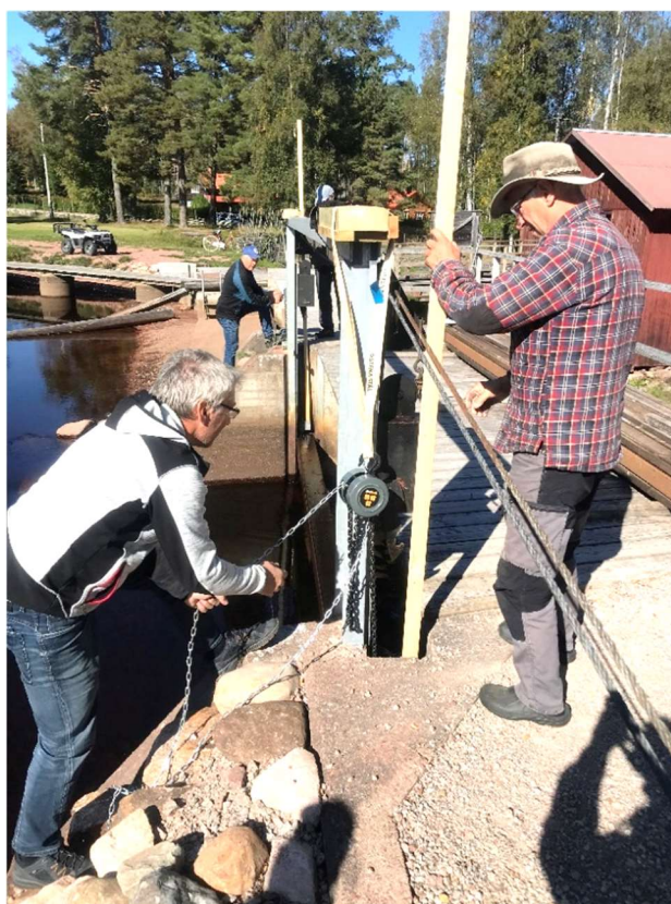
Bild 6. Sätten hissas upp.